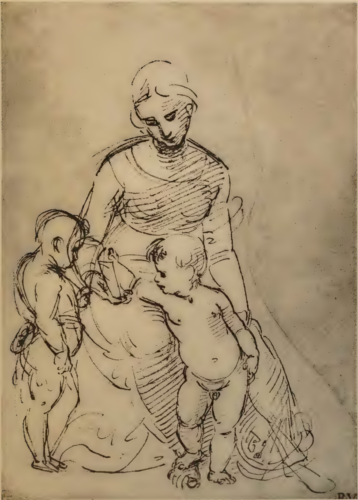
Dessin pour la «Vergine del Cardellino»